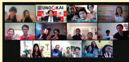
初対面でも競技を通じて打ち解けた参加者の皆さん。

次のウィキペディアネットサーフィン、ウィキペディアのクリスマスのページからスタートして、リンクを使ってFIFAワールドカップのウィキペディアページに誰が早く行けるかを競いました。最後の借り物しりとり