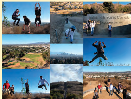
トレイルの先には絶景が待っていました。

今しばらく辛抱の時が続きそうですが、ダウンタウン地域部会では、安全にかつ健康的にLAを楽しんでいただけるよう、第2回の「“会えるかな” ハイキング」も企画中です。ご期待ください。