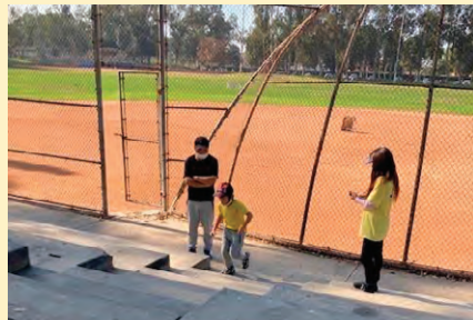
息を切らして走った階段5往復走!