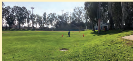
一人で奮闘中の様子。

僕は、お父さんに誘われて「一人ンピック」に参加してみました。最初、みんなでやるのかと思いましたが、1人でやると聞いて全然予想と違いました。小学校3年生なので、30m走、30mケンケン走、30m後ろ向き走、野球場一周、階段5往復走、鉄棒ぶら下がり、反復横跳びと縄跳びをしました。ちょっと怖かったけど一番楽しかったのは30m後ろ向き走でした。あと、鉄棒は思ったより全然ぶら下がれませんでした。一人でもなかなか面白かったです。