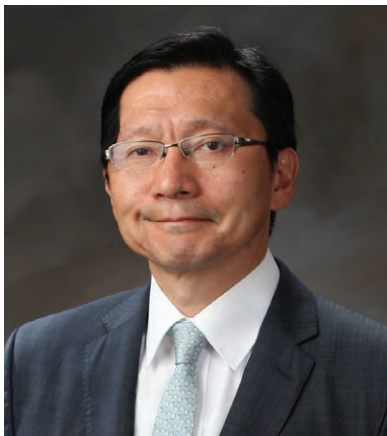
在ロサンゼルス日本国総領事