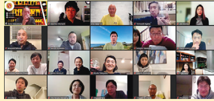
今回はオンラインで開催。次回はぜひ、インパーソンで開催したい。

事後アンケートの回答内容も好評で、グラスの違いでお酒の味が変わることにびっくりされていた様子でした。