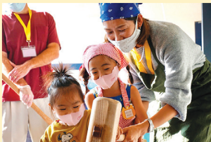
楽しそうに餅をつく子どもたち。

幼稚部の年間行事としては、4月の入園から始まり、5月の鯉のぼり、6月の虫歯予防デー、そして7月の七夕、秋には運動会、12月の餅つき、年が明けたら正月遊びの凧揚げ、2月節分の豆まき、と続きます。これらの伝統行事を保育の一環として盛り込むことで、日本文化について知ることはもちろん、行事に関する言葉もどんどん覚えていきます。また、このような大きな行事を行う際は、保護者の方々にも参加をお願いし、サポートしていただいています。保護者が学校の教育活動に参加することは、子どもの成長をさらに伸ばしていると考えています。