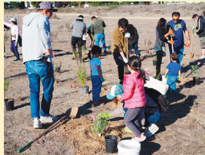
植樹に汗を流す参加者たち。

12月12日の日曜日、一家4人(夫、4歳娘、2歳息子、私)で「アッパーニューポートベイ自生植物保護活動」に参加しました。朝9時。澄みきった空気、 さんさん と輝く太陽の下、植樹会スタート。まずはパークレンジャーより植樹の作法や注意事項などの説明を受けます。その後、各自大きなスコップを手に取り、荒涼とした大地に散らばっていきました。スコップを誰が持つかで揉める4歳児と2歳児に不安を抱きつつ、我々も活動開始。夫と交代で穴を掘りますが、乾燥地帯のせいかがなかなか体力を消耗します。4歳児に「まだまだ!もっとだよ!」と叱咤されながら、穴を十分な大きさ・深