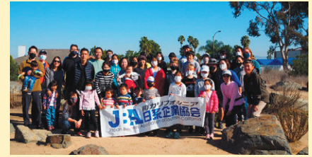
青空の下、皆で記念撮影。

さにする頃にはかなり汗をかいていました。掘った土の一部を穴に戻し、苗木を置き、残りの土を戻して苗木を埋め、その周りを囲うように高く盛り、水をやれば一つ完成です。植樹は初めてでしたが、時折レンジャーが様子を見にきては褒めてくれ(とにかく優しい!)、安心して取り組みました。他の参加者の方々も、時間が許す限り次々と植樹されていて励みになりました。