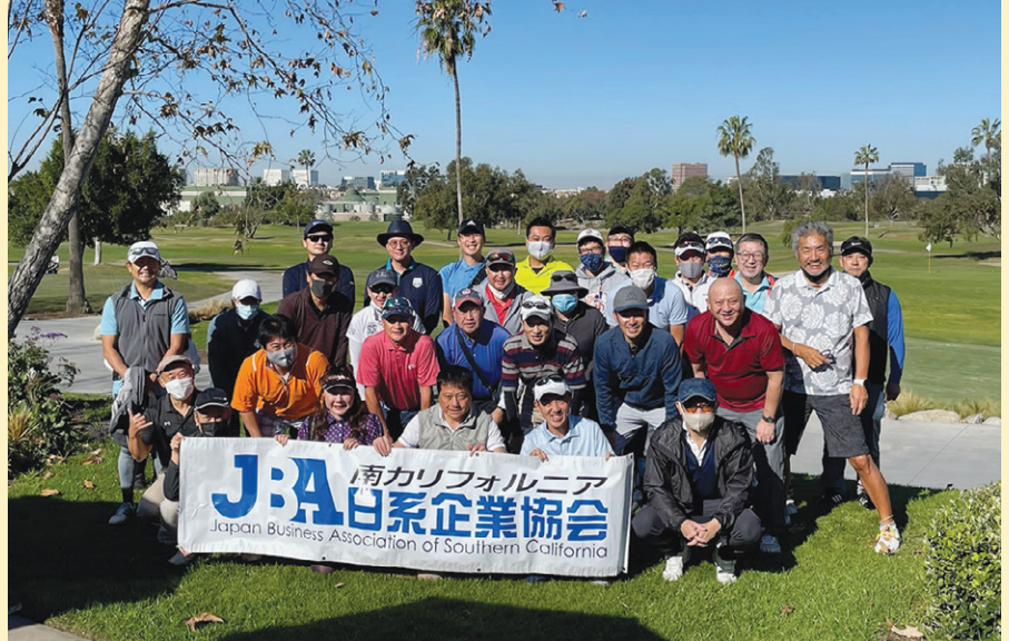
参加者一同による集合写真。

去る1月、「目指せ100切り! エンジョイ懇親ゴルフ!」に参加しました。当日は天候と同グループのパートナーの皆様にも恵まれ、楽しんでプレーができました。また企画運営をされたJBAのスタッフの皆様にも深く感謝申し上げます。私は、ゴルフ歴はそこそこ長いのですが、ベストグロス賞をいただくのは初めてで大変うれしく思います。パーとトリプルボギーが入り乱れ全く安定しないゴルフでしたが、幸いラスト3ホールで