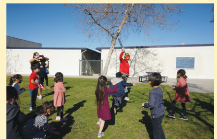
ついに鬼は退散しました!