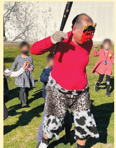
豆を持った子どもたちに追いかける鬼。

この園児たちは3月に卒園し、4月からの新年度には小学部に進学します。1年生では国語、算数を中心とした授業が始まり、3年生からは理科と社会も学習します。ロサンゼルスにあって日本の学習環境を取り入れ、質の高い教育を目指す本校では、在籍する子どもたちがグローバルに活躍できるように支援しています。