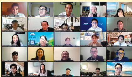
「オンライン新年交流会2022」の様相。

また、今年も多くの賞品をご提供いただきましたが、多くの提供会社様が嫌な顔一つせずに遠路、倉庫まで回収に来てくださいました。一方、例年会場入口でお渡ししておりました「干支の置物」を各所で配布致しましたが、多くの方にお受け取りいただけました。落胆の中でも心折れることなく最後まで尽力くださった担当委員に心から感謝するとともに、来年こそは晴れやかな開催ができることを願ってやみません。