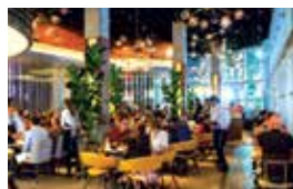
ハリウッドの元CBSの建物をリノベーションし、レストラン「Paley」とシェアオフィスを運営している。

イケイケのベンチャー企業で人手不足でしたから、入社と同時に神戸北野のレストランの立ち上げマネージャーに。右往左往しつつ無事にオープンしたものの、店が流行らず同期が新たにマネージャーに就任。東京に移動させてもらったのですが、翌年の社内査定でも評価は低いまま…。これではダメだと、