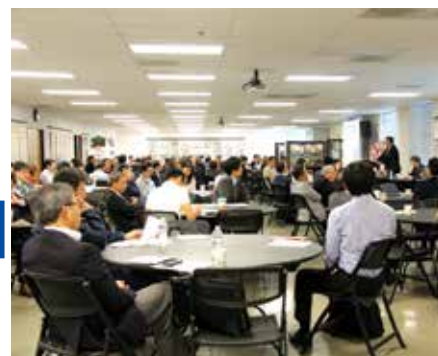
企業の関心も高く、会計部門担当者や会計士が多く参加した

去る3月10日、トランスのToyota Automobile Museumで、第201回JBAビジネスセミナーを開催した。大手監査法人Ernst & Youngから3名の講師を迎え、日本企業が備えるべき今後の税法改正の内容と対応すべき会計基準の変更について解説した。