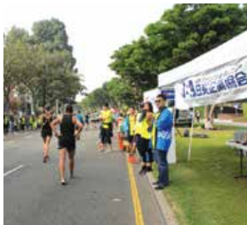
ゴールまで残り3マイル。23マイル地点は正念場です。