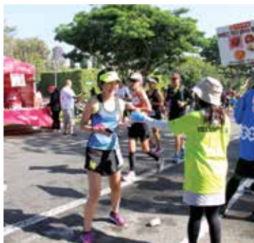
山崎製パンのあんぱんやヤクルトも大好評!