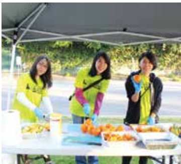
オレンジやバナナはランナーが食べやすいようにカット。