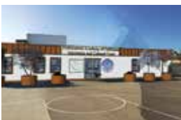
創立25周年記念事業の一つとして、今夏、日本語図書館兼カルチャールームを設置予定(写真はイメージ図)。

この移転が本当に大変でした。まず場所探しに苦労し、ようやくロミータにいい場所を見つけたものの、日本人が日本の教育を行う学校を開く、ということに近隣住民からは激しく反対され、市からもいい顔をされず…。しかし、何カ月もの間、近所の家に一軒一軒回って辛抱強く説明を続けると同時に、市役所に何度も通い、市長や市議