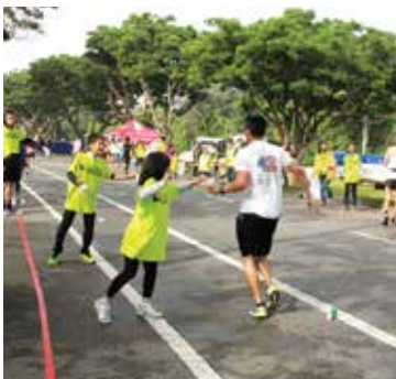
「ありがとう」とお礼を述べながら走り去るランナー。