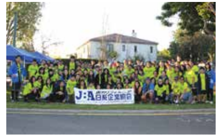
ボランティアの皆さん、朝早くから懸命に働いてくださり、ありがとうございました!

高速で通過するエリートランナーに続き、午前10時前後から一般ランナーも続々と通過。午後2時頃まで、水や果物を差し出しながら、「頑張れ」「GO!」と応援の声を送った。JBAのバナーや法被など「日本」を全面的に押し出したブースはひと際目立っており、中にはボランティアの写真を撮影して走っていくランナーも。日本そしてJBAの南カリフォルニアにおけるプレゼンスを地域にアピールする格好の機会となった。