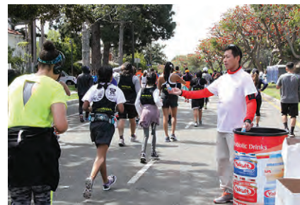
ヤクルトや山崎製パンのあんぱんも大好評！