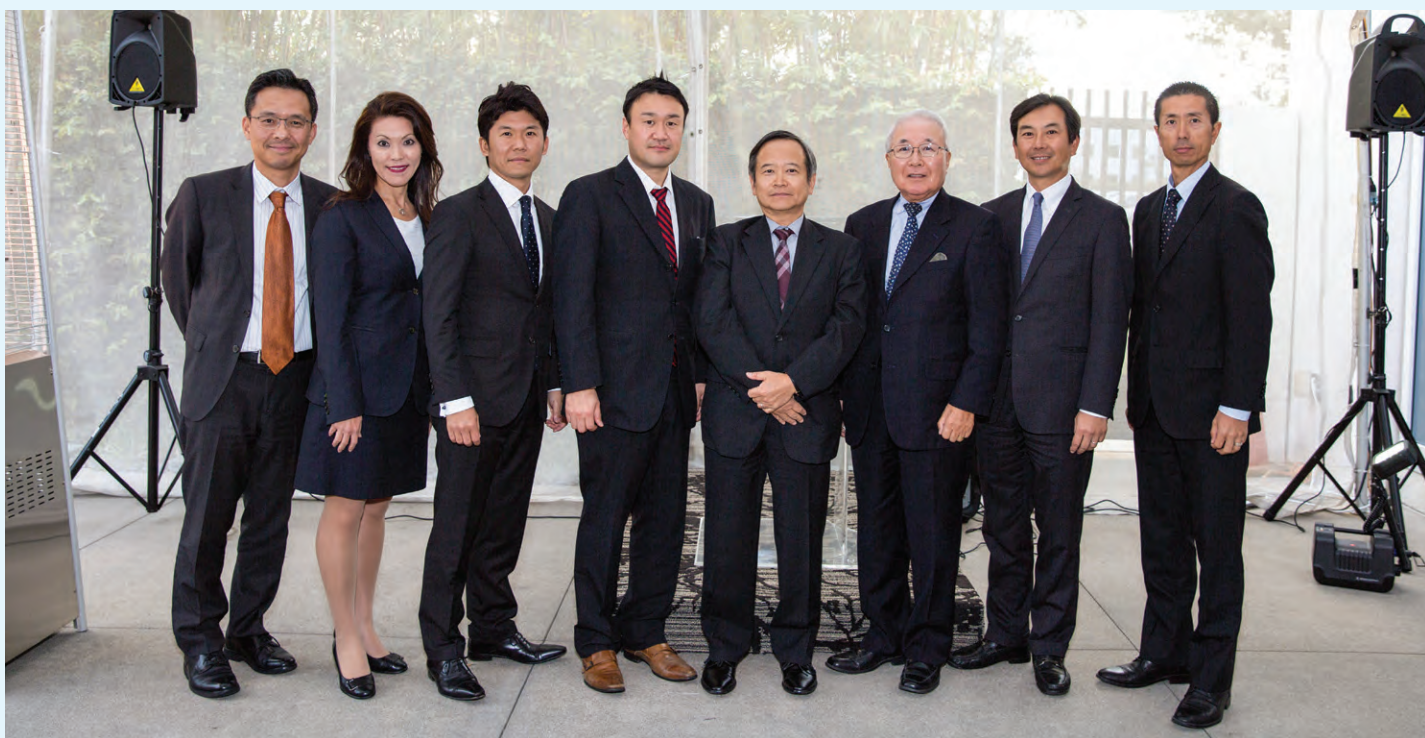
去る3月16日に、2017年度JBA総会およびあさひ学園総会と、18年度JBA常任理事会およびあさひ学園理事会を開催した(写真は2018年度JBA新役員。詳細はp.2-6参照)。