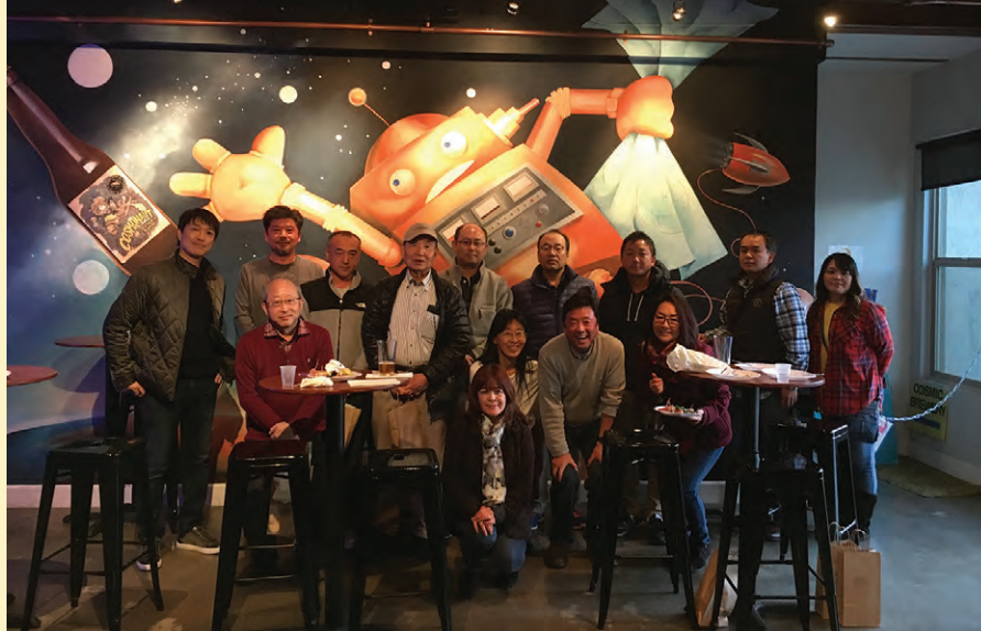
Cosmic Breweryで記念撮影! お酒も入り、皆さん自然と笑顔がこぼれます。

4月7日の始業式、翌週14日の入園・入学式をもって、2018年度1学期が始まりました。4校で幼稚部90名、小学1年生150名を含む、合計1400名程で新年度を迎えました。子どもたちにとっては、新たな学年でさまざまなチャレンジがある中、新入生・編入生の新しいお友達にも出会い、新鮮な日々を送っている様子です。