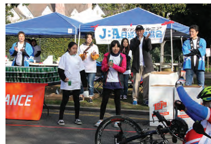
JBAのブースからランナーたちに熱い声援を送るボランティアの皆さん。

大会が始まると、ランナーたちが続々と通過。ボランティアたちは「頑張れ〜」「Water!」などと声をかけながら水やフルーツなどを差し出した。ブースの大きなバナーや法被も手伝って、JBAのプレゼンスをしっかりアピールする機会となった。