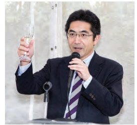
左から、大川2018年度JBA会長から石川2017年度JBA会長に感謝のタテを贈呈、新旧のJBA役員に謝辞を述べる千葉在ロサンゼルス日本国総領事、乾杯の音頭を取る西本JETROロサンゼルス事務所長。

実施。約2万7000ドルを24校に分配した。また、これらの教育活動資金を集めるチャリティーゴルフトーナメントでは、8万1000ドル集まった。