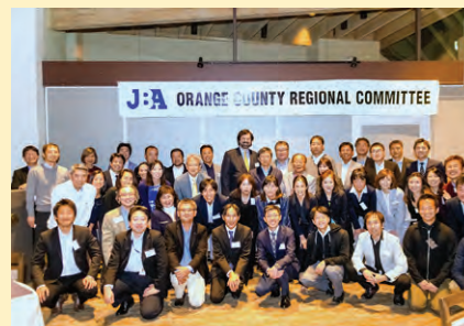
「会員還元!期末大懇親会!」と銘打って行われた、オレンジカウンティ地域部会の懇親報告会。

地域部会は今年も引き続き、各地域の皆さんのお役に立てるよう活動を行ってまいりますので、ご支援のほどよろしくお願い致します!