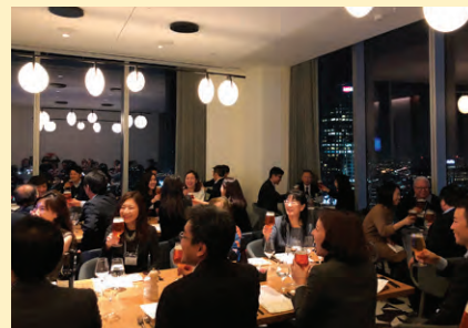
ダウンタウン地域部会の懇親報告会。地上69階からの眺めは見事でした。