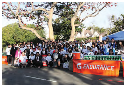
朝早くから懸命に働いてくださったボランティアの皆さん、本当にお疲れ様でした。そして、ありがとうございました！

絶好のマラソン日和となった当日、企画マーケティング部会員はまだ暗い午前5時半頃から集まり、機材の搬入を開始。朝7時頃からはボランティアも続々と集まり、栄養ドリンクや水を並べるなど、ランナーたちをサポートする準備を進めた。