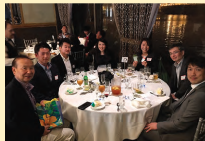
サウスベイ地域部会では、協賛企業からの賞品をかけたクイズや名刺ビンゴなども実施。大いに盛り上がりました。