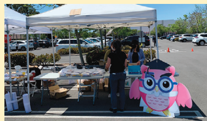
あさひ学園マスコット、ごじゅうろうせんせいがお出迎え。

例年であれば各校の教室にて渡している教材ですが、昨年度に引き続き、今年度も1人分ずつの個包装を請け負ってくださった業者の方には、本校での教育活動に大きく貢献していただいていることに感謝です。16歳以上のワクチン接種が始まり、COVID-19感染も収束に向かい、経済活動も活発になり始めています。今年度中には、本校も開校し子どもたちと先生との対面授業ができることを強く期待しています。