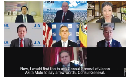
日系企業と地元社会との協力が確認された、パネルディスカッションの様子。

後半は、ジャパン・ハウス ロサンゼルス海部優子館長を進行役に、「JBAの60年間の活動の振り返り」をテーマとしたパネルディスカッションを行った。パネリストの一人、武藤顕在ロサンゼルス日本国総領事は「日本とカリフォルニアは今後も気候変動にコラボレーションで取り組んでいきます」と、日本と地域の絆を強調。エリック・ガルセッティLA市長は「我々は友達を越えて家族の関係です」と日本が特別な存在であると続けた。三森JBA会長は「日系企業にとって、カリフォルニアにはインフラの構築をはじめとして、我々が投資する理由がある」と語った。ボブ・ハーツバーグ加州上院議員も「グリーンパワーの分野で日系企業が重要な役目を担っています」と断言。続いてアル・ムラツチ加州下院議員