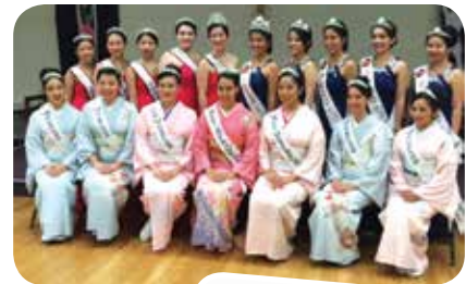
二世ウィーク・クイーンとプリンセス(前列)。

このほかにも二世ウィーク中にはいろいろなプログラムが満載です。www.niseiweek.orgにて確認してください。なお駐車場をつなぐシャトル・バスもメトロが協賛して準備されています。ぜひ皆様も第77回二世ウィーク・ジャパニーズ・フェスティバルへ参加してみてください!