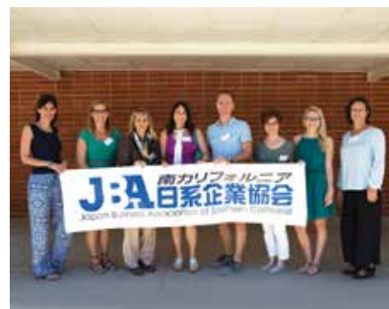
今年訪日するUSEJプログラム参加者の8人。

私も、最後は自信に満ちた人間に変化していました」「どれだけ時間を有効利用しても足りないほど素晴らしい経験が待っています。日本はとても美しく人は親切で、ストレスを感じることはないでしょう。日本に行けば皆さんは本当にラッキーですよ」など、さまざまな感想とアドバイスを紹介した。