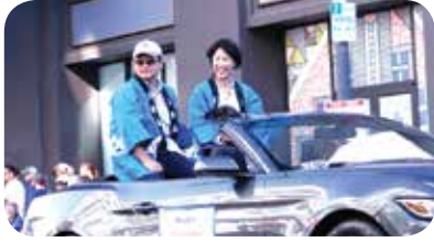
毎年、JBA会長もグランドパレードに参加します。

ダウンタウン・ロサンゼルスのリトルトーキョーで行われる「二世ウィーク」は1934年に第1回を開催。第二次大戦中の収容所時代は開催できなかったものの今年で77回目です。JBAも地域貢献・文化支援活動の一環として、毎年このフェスティバルを支援しております。