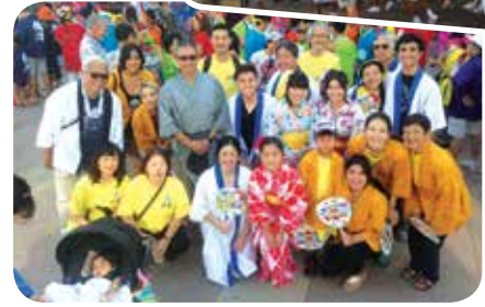
DT部会では今年も二世ウィーク参加イベントを開催予定です。