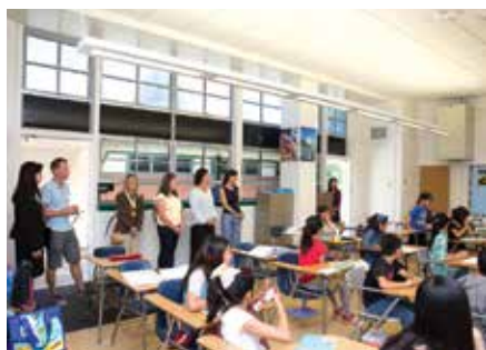
あさひ学園の授業を視察する参加者たち。

次にJBA会員の自己紹介を行った後、昨年の参加者らが自身の経験を踏まえて自己紹介。「全ての経験が素晴らしかったです。ホテルにこもって時間を無駄にしないで、一瞬一瞬の機会を自分のものにして下さい」「USEJによる日本滞在は私の人生で最も素晴らしい経験の一つでした。綿密に準備されたプログラムで、最初緊張していた