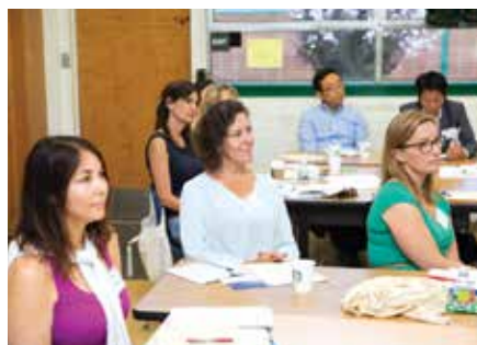
真剣なまなざしでオリエンテーションに臨む参加者。