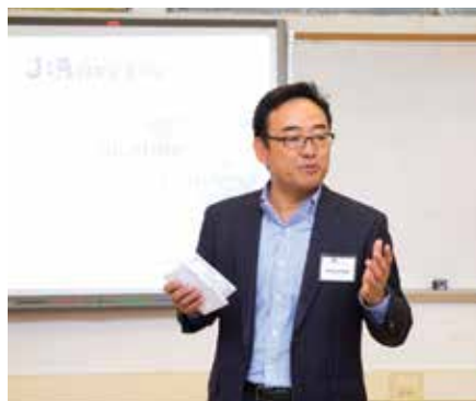
参加者らを激励する尼崎教育文化部長。

USEJプログラムはJBAの教育支援活動の一環で、日系企業の駐在員子弟を受け入れているアメリカ現地校への謝意と対日理解の促進を目的として始まった。特にJBA会員の子どもが多く通う学校区からアメリカ人教育関係者らを選抜し、面接などを通して各地域部会が派遣者を決定。日本滞在中は学校訪問やデモ授業の実施、日本人教師らとの交流など教育関連プログラムのほか、東京、奈良、京都、広島での観光やホームステイなど文化交流プログラムも実施。その体験をアメリカの教育現場で生かし、日本への理解と日米関係の強化に役立ててもらおうことを狙っている。