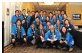
2012年から4年間、企画マーケティング部会員として、賞詞交歓会やミキサーの開催に奔走した。

あって。すでに子どもが2人いたので、あまり長い間収入がないのもまずいですからね(笑)。幼