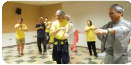
大音頭(盆踊り)に参加するため練習に励むDT部会員。

昨年からダウンタウン地域部会が主体となり、JBAチームとしても大音頭(盆踊り)の踊りの輪に参加。今年もダウンタウン地域部会は盆踊りに合わせてイベントを予定しています。すでに浴衣を調達し準備万端の方もいるようです。今年のイベントでは、まずリトルトーキョーにある全米日系人博物館を見学し、全米日系人博物館の一室で盆踊りの練習を行った後、リトルトーキョー路上での盆踊