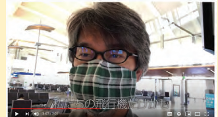
TripToTokyo.JBA 458 回視聴 - 2020/09/14

このような動画を、JBA会員の皆様から募集しております。趣味、特技、耳寄り情報など、2、3分程度のスマホで撮影した動画を、Eメールで「 jbadt@jba.org 」までお送りください。なお、ビジネス目的のプロモーションはNGとなりますので、あらかじめご了承ください。