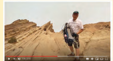
ハイキングの道具を紹介します 229 回視聴 - 2020/09/15