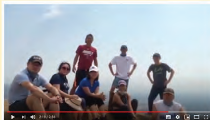
ダウンタウン地域部会-トレイル紹介-Rocky Peak Trail 312 回視聴 - 2020/08/26

「特別版 日本往復の実情報告」 提供:佐野尚吾さん (Hive Los Angeles LLC) 日本入国編: https://youtu.be/V1wFx6hveRs 米国入国編: https://youtu.be/A6TuJYaJGVM 新型コロナウイルスの影響で、日本入国時の検査などが気になるアメリカ在住者にとって参考になる、日本の空港とアメリカ再入国時のLAXでの体験動画です。