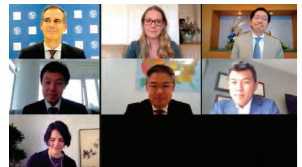
オンライン・ラウンドテーブルに参加した面々(一部)。

WTCLAのプレジデント、スティーン・チャン氏(LAEDC COO 兼務)も、『FDIレポート』などを通して日本の貢献について引き続き発信していくと述べ、最後に、ハチギアン・ロサンゼルス副市長が、「日本はロサンゼルスにとって重要なパートナーと言われているが、今回、その理解が深まった。何か協力できることがあれば、いつでも連絡がほしい」と述べた。