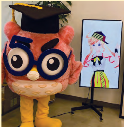
ごじゅうろうせんせいとアソビリンちゃん。