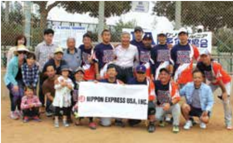
3位 Nippon Express