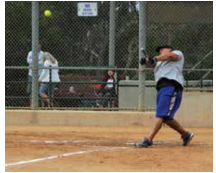
決勝トーナメント初戦ではOCS/KDDIに1点差まで詰め寄せられ、冷や汗をかけた優勝候補のYamaha Motor-B。