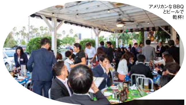
アメリカなBBQ とビールで 乾杯!

去る9月28日、タスティンにある Lucille's Smokehouse BBQ で異業種交流会(ミキサー)を開催した。今回は最初テーブルに着席し、後に座席をシャッフルするという新趣向で開催。いつもの立食スタイルとは違い、深い交流が楽しめたと大好評だった。(皆さんのお名前は左から)