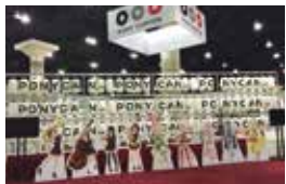
Anime ExpoでのPony Canyonのブース。出展手続きからブースデザイン、印刷、施工まで全て手掛けた。

LA 駐在は 2013 年から。それまでは 1992 年に大日本印刷に入社してからずっと出版印刷の営業をしてきました。さまざまなことをさせてもらいましたが、中でも糧になったのはデザインとグラフィックの雑誌「MdN」の仕事です。その雑誌に関わる中で、インクにラメを入れたり立体に見えるホログラムにしてみたりと一般流通する雑誌ではやっていなかった特殊印刷を表紙で紹介する企画を手伝わせてもらいました。こういう特殊な印刷は工場から最初「できない」と言われることが多いのです。そこを「出版印刷機では無理でもパッケージを作る機械ならどう？」と提案したり、協力会社の人に技術協力をいただいたりしながら実現していきました。新しいことを次々やって面白かったのですが、初めて植毛印刷（短い繊維を植え込む印刷）をした時は工場中が毛だらけになって大変な思い出もあります（笑）。