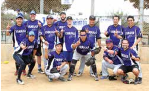
優勝 Yamaha Motor-B