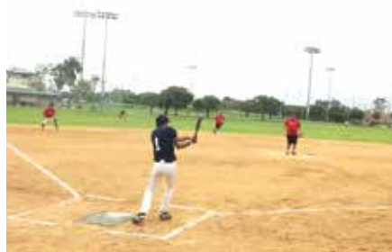
最終回、3点差を逆転して1回戦を突破したDeloitte。ベスト8まで勝ち進んだ「K」Lineの検討も講えた。

Fujitsu Ten対Nippon Expressは、6回表終了の時点でNippon Expressが10対8でリードしていたが、その裏、Fujitsu Tenが4点を取って12対10と逆転。しかし最終回表、Nippon Expressが4点を取り返してさらに試合をひっくり返すと、その