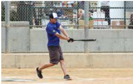
大会を通して躍動感溢れるプレーを見せたTokio Marineだが、3位決定戦ではNippon Expressに13対7と破れる。

Nippon ExpressとYamaha Motor-Bはさらに見応えのある試合に。初回裏、Yamaha Motor-Bがいきなり7点を入れ突き放したが、そこからNippon Expressが毎回コツコツ加点していき、5回終了時点には10対8でわずかにYamaha Motor-Bがリードという展開。6回にNippon Expressが1点、Yamaha Motor-Bが3点を加えた