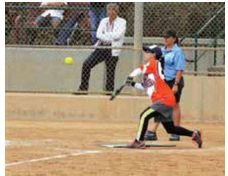
女性プレイヤーの活躍も光り、大会を沸かせたNippon Express。初回に取られた7点が効いて準決勝敗退。