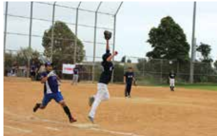
決勝戦はYamaha Motor-B、Deloitte共に気迫あふれるプレーの応酬! 見応えのある試合となった。