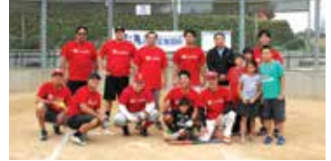
6位 "K" Line