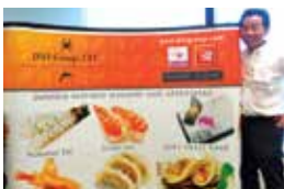
米国では、寿司ネタの海産物をはじめとする食品、化学品などさまざまな分野で事業を展開している。

日米間でのビジネスでは往々にしてあることですが、国ごとに考え方が違うため常にギャップが存在します。言葉よりも日米それぞれの思想を通訳するような立場で、若い私はベテランのサプライヤーとお客様の間で大変迷惑をおかけしたにもかかわらず、教育もしていただき感謝しています。当時はインターネットが普及する以前の時代でしたから、急ぎの時はアメリカが朝になる夜中にファックスを送ってさらに電話をしたり…。そんなふう遅くまで仕事する