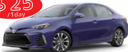
TOYOTA COROLLA (トヨタカローラ) 等