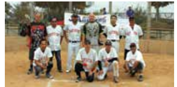
7位 Fujitsu Ten