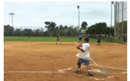
抜群の勝負強さで最終日まで勝ち上がってきたFujitsu Tenだが、最終日初戦、2点差の惜敗で大会を去った。