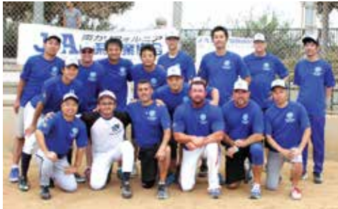
4位 Tokio Marine