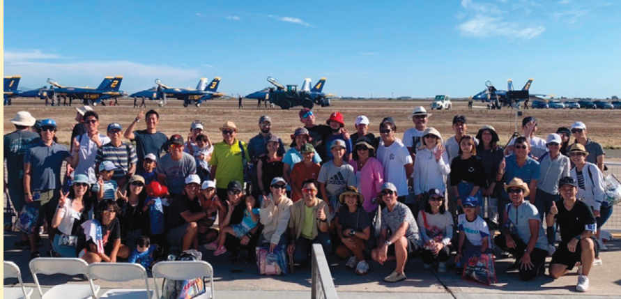
エアショーを見学し、大満足で記念写真を撮影。