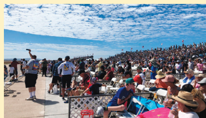
ブルーエンジェルスが真正面に見える最前列で観覧。

そして最後は待ちに待ったNavyのブルーエンジェルスのパフォーマンス。パイロットたちが整列してキビキビと進み順番に機体に入り込んでいく様子は映画さながら。『トップガン』のあの曲をBGMに隊列を組んで左右後ろから次々に飛んでくるブルーエンジェルスに、気分は最高潮。アメリカのイベントは音楽を使った盛り上げ方が本当にうまいと感じました。