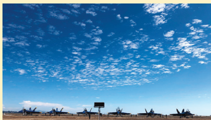
ミラマー基地に整列した戦闘機。