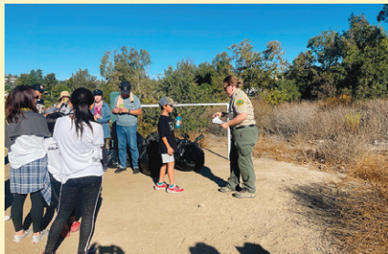
レンジャーから自然保全の活動を学べる貴重な機会になりました。

特にパンデミックが始まって以降、各地のトレイルに行く機会が増え、運動不足の解消や子どもと共に体力づくりを楽しむことが多くなりました。普段自分たちが利用させていただいているトレイルでレンジャーの方々の仕事内容に触れ、また自然保全活動の一部を知ることができました。レンジャーの方が植林活動以前の丘と目標とする茂みの状態を見比べて説明してくださり、活動はまだまだ道半ばということが理解で