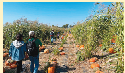
畑にゴロゴロと転がっている中から好みのパンプキンを選びました。

ツアーのメインイベント、パンプキンパッチは畑にゴロゴロとあるパンプキンの中から自分好みのものを探しました。すっかり時間を忘れながら、1時間弱、夢中で好みのパンプキン探しをしてしまいました。家族4人分、4つのパンプキンを持ち帰り、家のエントランスに飾ると一気にハロウィンの雰囲気が出ました。今は、ハロウィン直前に家族でジャコランタン作りを計画していて楽しみです。ツアーに参加して、秋を感じながら満足いく休日になりました。