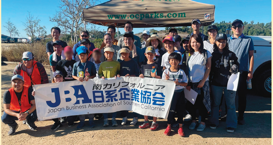
青空の下でボランティアに汗を流した後、笑顔でグループ写真を撮影。

きました。自分たちが水をやり、周りの掃除をした苗木たちが今後も少しずつ成長し続けることを願います。