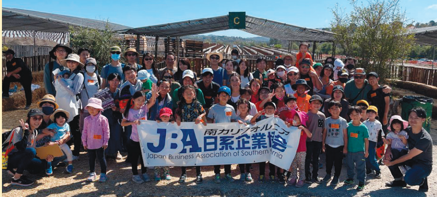
時間を忘れてパンプキン狩りを楽しんだ参加者全員で、記念撮影。