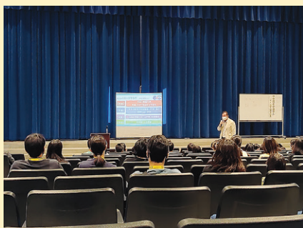
中学部進学説明会の模様。

同じ家族から2名以上が合格した場合は、日本漢字能力検定協会より「家族合格表彰状」が送られます。家族で一緒に受検することで、親子、兄弟姉妹で同じ目標に向かって互いに励まし合うことができ、漢字学習に取り組む一つのきっかけにもなります。