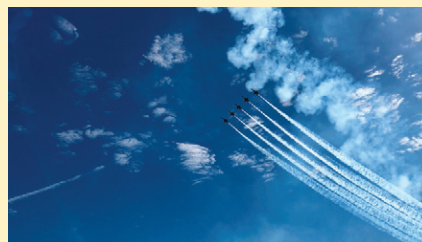
華麗なエアショー。

る、一直線に上がり、エンジンを止め(?)「墜ちるー!」と思わせて、またスモークを出してらせんを描くように飛ぶアクロバット飛行が見事でした。飛行機だけではなく、アクション映画に出てくるような火を噴くトラック、「Jet Truck」の走行も迫力満点。Air Forceの最新鋭の戦闘機と第二次世界大戦や朝鮮戦争、ベトナム戦争の時代に使われた戦闘機が並んで飛行する様は、歴史を感じさせるものでした。