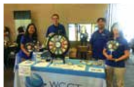
日系コミュニティーのイベントにブースを出すなどして、随時、健康な日本人の治験参加者を募集している。

決意。LA、それもサウスベイエリアなら日系企業が多くあり、自分の日本語力を生かせるいい