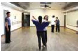
40代後半で始めた社交ダンス。インターナショナルスタイルを中心に、土日開講のクラスで教えている。

その後、商社、船会社、ロジスティクス会社を経て、1985年にLA港で働き始めました。僕の仕事はマーケティングで、