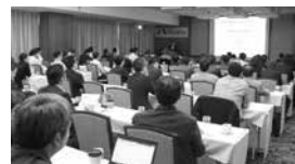
詳細なデータを含んだ60枚にもおよび資料をじっくりと見ながら、耳を傾ける参加者

米国経済の本格回復に向けては明るい動きも見えている。まず、シェールオイルの生産拡大が、石油製品輸入の減少・石油製品輸出の増加を通じて成長率を0.2%~0.3%程度押し上げてきている。もうひとつは、米国の労働市場の特徴であった流動性が戻りつつあることだ。失業率が低下してきたことで、労働資源の移動、つまり転職活動が徐々に活発化しつつある。通常、転職に伴って賃金も上昇するため、これは家計の所得や消費増加につながるはず。労働力がより生産性の高い企業・業種に移ることになるため、これは長い目で見れば、潜在経済成長率の上昇にも寄与するだろうとして講演を締めくくった。講演後の質疑応答では、中国経済の動向などにも話が及んだが、中国経済は今後の世界経済の大きなリスク要因である一方、米国の中国向け輸出は小さいため、米国経済への影響は相対的に限られるだろうと答えた。