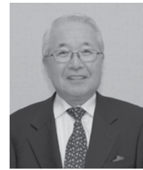
筆頭副会長・ あさひ学園部会長・ セクレタリー

日本に帰国する子どもが日本の教育に円滑に適応できる教育、国際社会に貢献できる子どもを育成する教育を目指し、さらなる教育の質向上、および関係者全員が相互に協力できる環境整備に努力していきます。