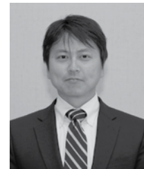
副会長・ ダウントウン地域 部会長

「LAをもっと知る、もっと好きになる」。恒例行事に新規企画を絡めたイベント運営の他、JBA ニュースへの連載、ボランティア企画など、ダウントウン地域部会ならではの多彩な活動を実施します。