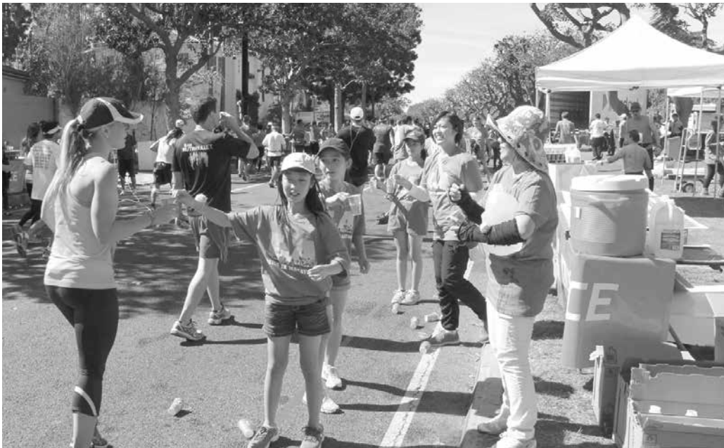
3月9日のロサンゼルスマラソンでは、今年もJBA会員有志によるボランティアを実施。ゴール目の23マイル地点で、水やオレンジ、アンパンを手渡し、ゴールを目指すランナーを応援しました(詳細はp.7)