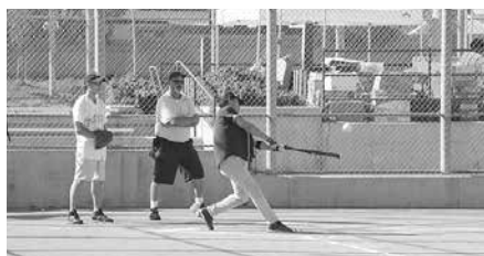
Nippon ExpressとFujitsu Tenの試合では、Nippon Expressの重打線が大爆発!

Nippon ExpressとFujitsu Tenの試合は、両者ともここまでの2試合20得点以上と、打撃が売りのチームだったが、Nippon Expressが21対0という一方的な内容で試合を制した。しかし、ここまで勝ち上がってきたFujitsu Tenの実力には疑いがなく、