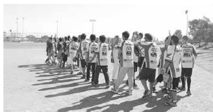
American HondaがMitsubishi Electricを破った試合は今大会最大のサプライズ。試合後は互いが健闘を讃え合った