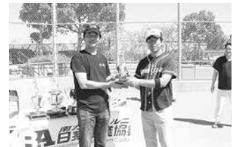
昨年に続き今年も 3 位の座に着いた Nippon Express は、安定感が光った