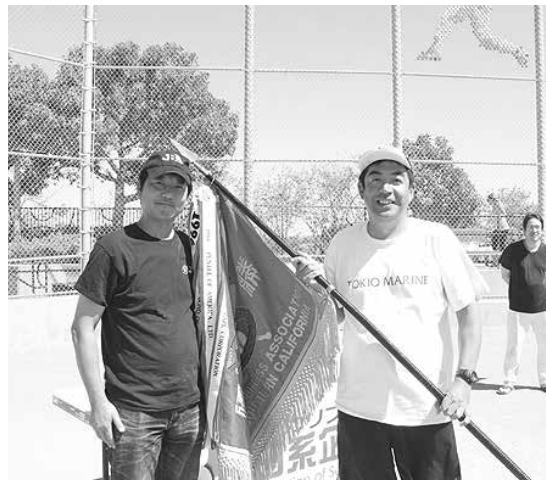
栄光の優勝旗を授与された Tokio Marine。とにかく「勝負強い」印象を強く残した同チームの来年の活躍も期待したい

大会終了後の表彰式では、山田企画マーケティング部会長が各チームにトロフィーを手渡し、2 週にわたる激闘の疲れを労った。絶対王者 Mitsubishi Electric の陥落、新王者 Tokio Marine の登場、American Honda の台頭など見所の多かった今年のソフトボール大会。来年も楽しみにしていきたい。