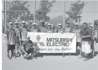
6位 Mitsubishi Electric