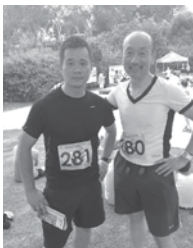
レース2日前に思い立って参加したトレイルランで、年齢別グループ4位を記録。以後、本格的に練習を開始

商業施設内の飲食ゾーンをプランニングする会社で働き始めたのですが、名刺の渡し方などマナーも分からず、豊に土足で上がったこともありましたが…でも顔付きが日本人だから日本のことを分かっていた当たり