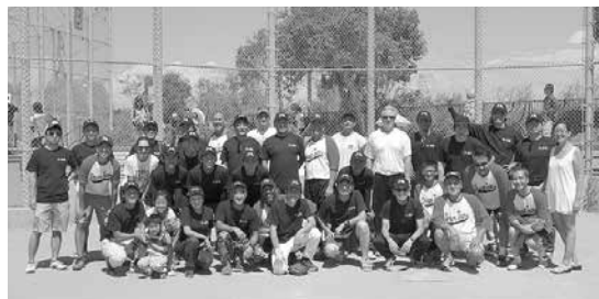
2日目に行われた米日カウンスル・ドリームチームとJBA選抜オールスターチームの親善試合に出場した面々

去る9月6日、7日、13日、14日の土日、2週にわたり第51回ソフトボール大会を開催した。45チームが参加した今年も、優勝旗を目指して熱い勝負が繰り広げられた。7日には第5回となる米日カウンスル・ドリームチーム対JBA選抜オールスターチームの親善試合も行われ、大いに盛り上がった。