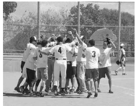
サヨナラ逆転で優勝が決まった瞬間、Tokio Marine の選手たちが喜びを爆発させる