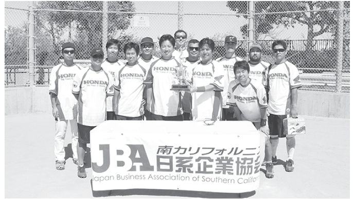
準優勝 American Honda