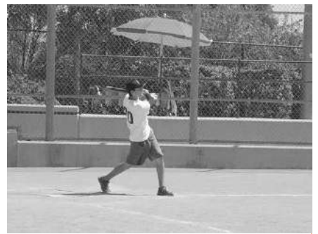
Tokio Marine 対 American Honda の決勝、最終回での Tokio Marine の猛攻は本当に見事だった