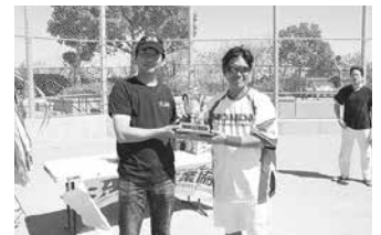
Mitsubishi Electric を破り新たな歴史を作った American Honda が堂々の準優勝