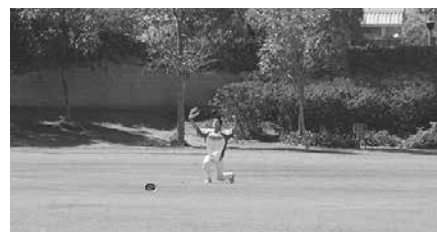
準決勝のAmerican Honda対Konoike戦。最後の打者の外野フライをAmerican Hondaの選手が見事キャッチし、ゲームセット