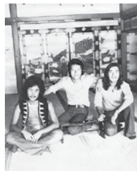
高校時代は後のゴダイゴ等のメンバーらとバンドを組み、葉山マリーナなどでコンサートを開催(写真右)

それに、ゆくゆくは日米の架け橋になって仕事がしたいとも思っていました。高校の頃から米軍基地でアルバイトをしていたのですが、言葉や文化の違いで米国人と日本人