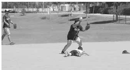
両者が攻撃、守備共に力を出し切った準決勝の Tokio Marine 対 Nippon Express

そして、ついに決勝戦。抜群の勝負強さで勝ち上がってきた Tokio Marine と、初戦で Mitsubishi Electric を撃破し、一気に優勝候補に浮上した American Honda が相まみえた。初回裏、Tokio Marine が 2 点を先制。しかしその後 American Honda