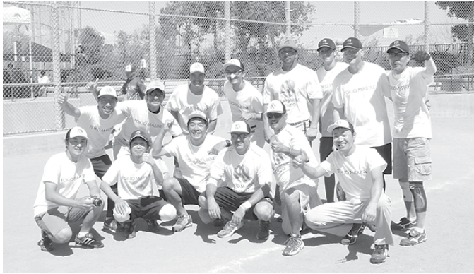
優勝 Tokio Marine