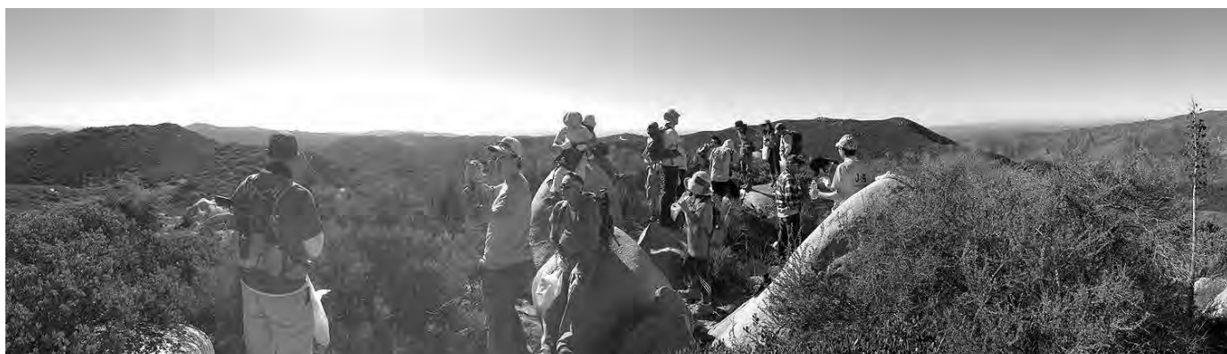
去る11月22日、今年度2回目となる3地域部会合同企画のゴミ拾いハイキングが開催された。ハイキングの楽しみとゴミ拾いによる社会貢献のやりがいを一度に体感できる人気イベントである。(詳細はp.11)