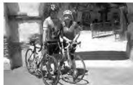
5、6年前に始めた趣味のロードバイク。愛妻とチャリティーライドを走ることも。

当初は帰国予定でしたが、そのうち「アメリカで暮らしたい」と考えが変わり、就職活動をするもうまくいかない。仕方なく、アイダホ州の母校へ戻り、学生のアドバイザーとしてアルバイトをしていました。ある日、語学学校の秘書の方が『日本経済新聞』の英語版に載っていた求人情報の切り抜き