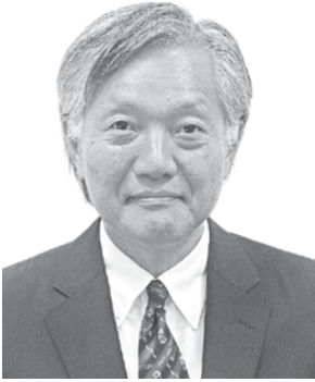
在ロサンゼルス日本国総領事