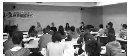
本番を3カ月後に控え、マラソン初挑戦に意気込む参加者からの質問に答える講師たち

去る11月15日、トーランスのリダックゲートウェイホテルで、「LAマラソンを走ろう！マラソン準備講座（第1回—計画編）」を開催した。来年2月のマラソン本番に向け、講師として招かれたスポーツ用品メーカー担当者、トレーニングコーチ、スポーツ専門カイロプロクターが、初心者から経験者にまで役立つアドバイスを送った。