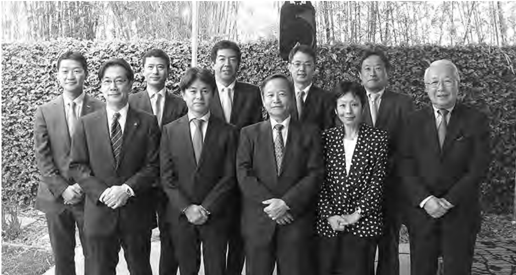
去る3月18日、2015年度JBA総会と2016年度JBA常任理事会が開催され、2016年度の新体制が発足した。 写真は2016年度新役員。(詳細はp.2-5)

2016年4月号から1年間、 JBA NEWSの偶数月号はデ ジタル版を配信しています。 次号6月号は、6月1日にメー ルマガジンでお届けします。